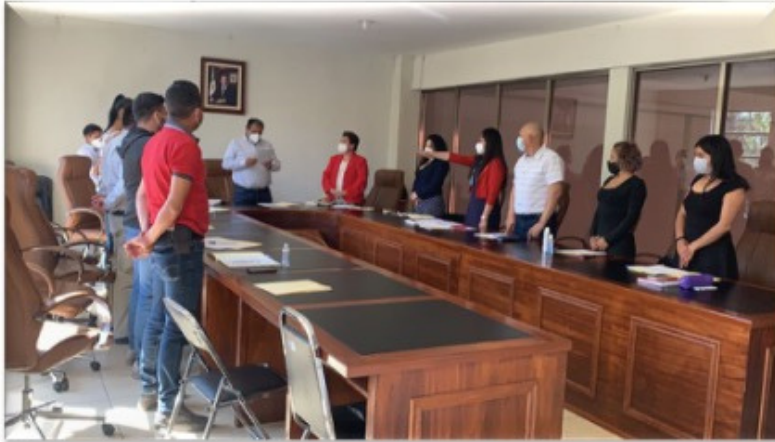
05 de marzo; Toma de protesta como regidora municipal.

Participé en el análisis, discusión y aprobación para la instalación del Consejo Municipal de Población.